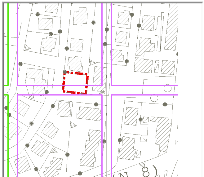
Mappa della trasformabilità