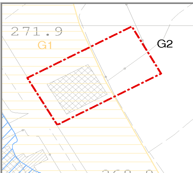
Mappa delle pericolosità