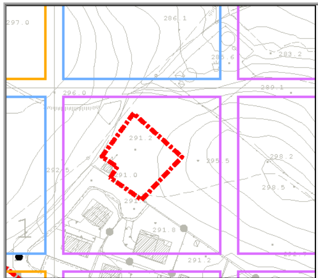
Mappa della trasformabilità