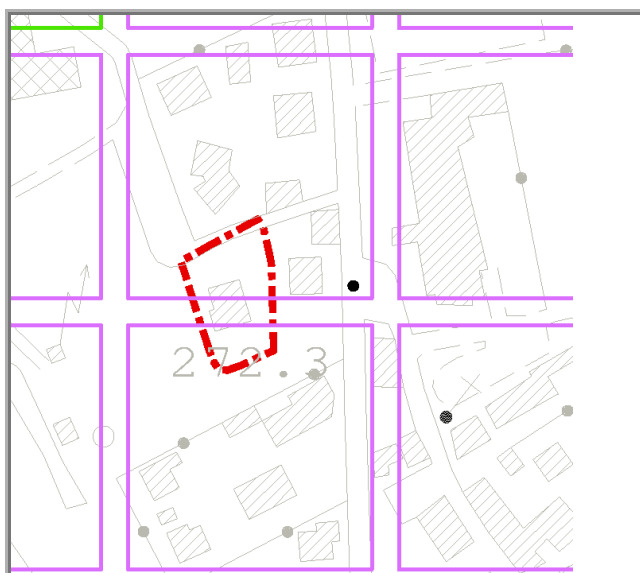
Mappa della trasformabilità