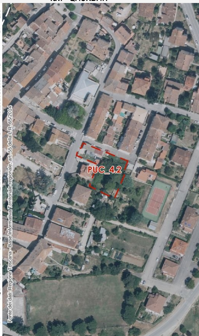
Ortofoto 2021 – scala 1:2.000