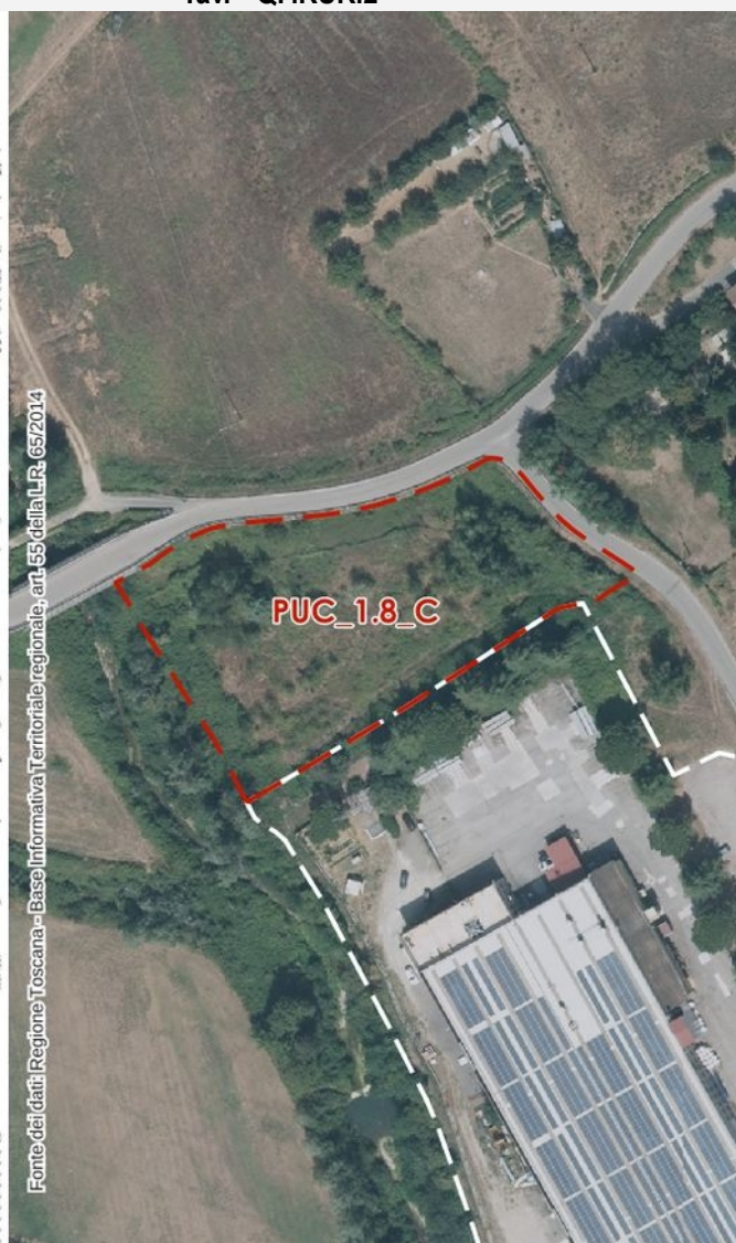
Ortofoto 2021 – scala 1:2.000