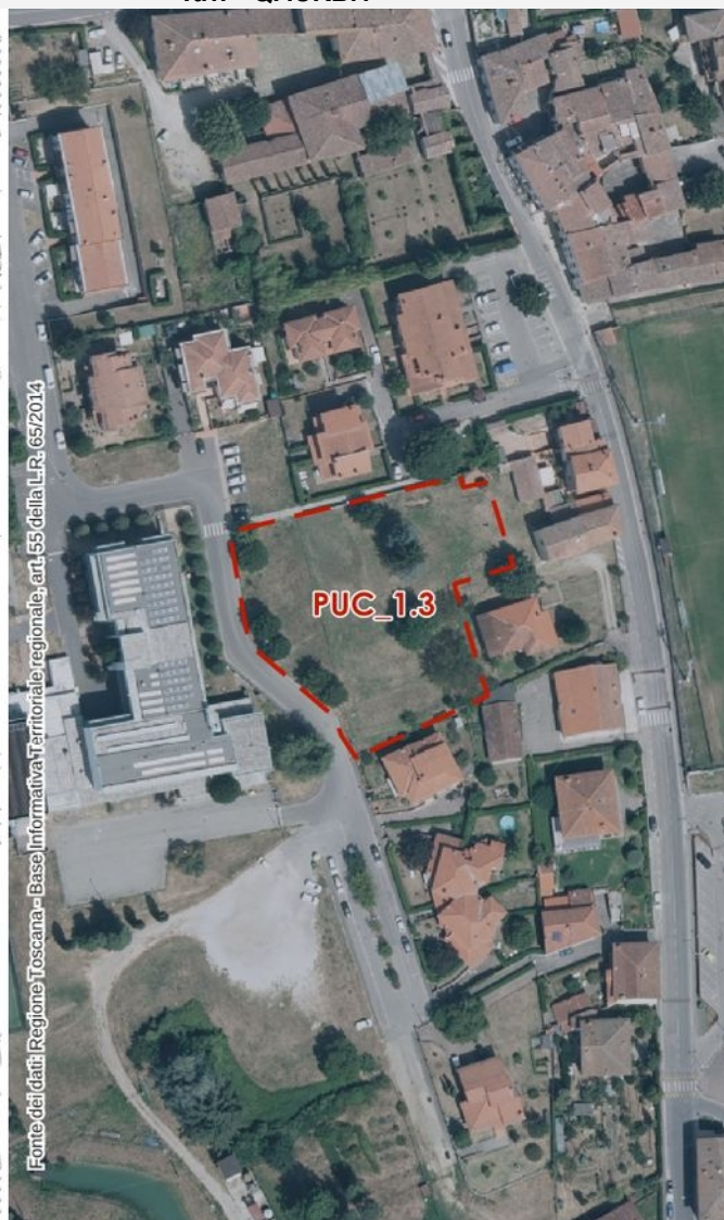
Ortofoto 2021 – scala 1:2.000