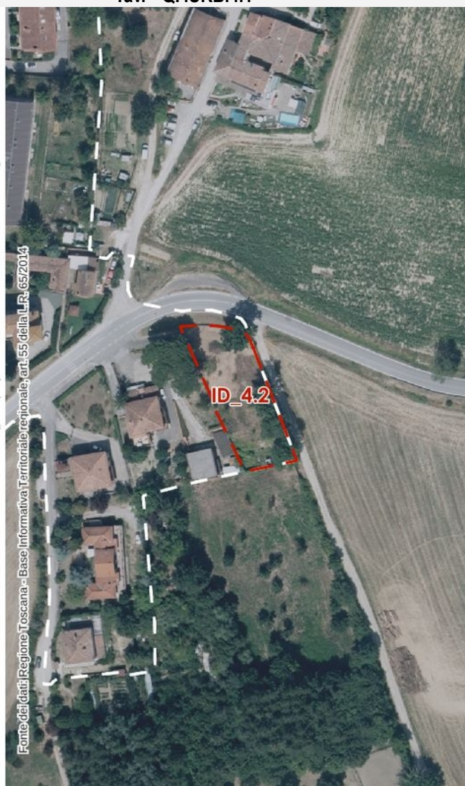
Ortofoto 2021 – scala 1:2.000