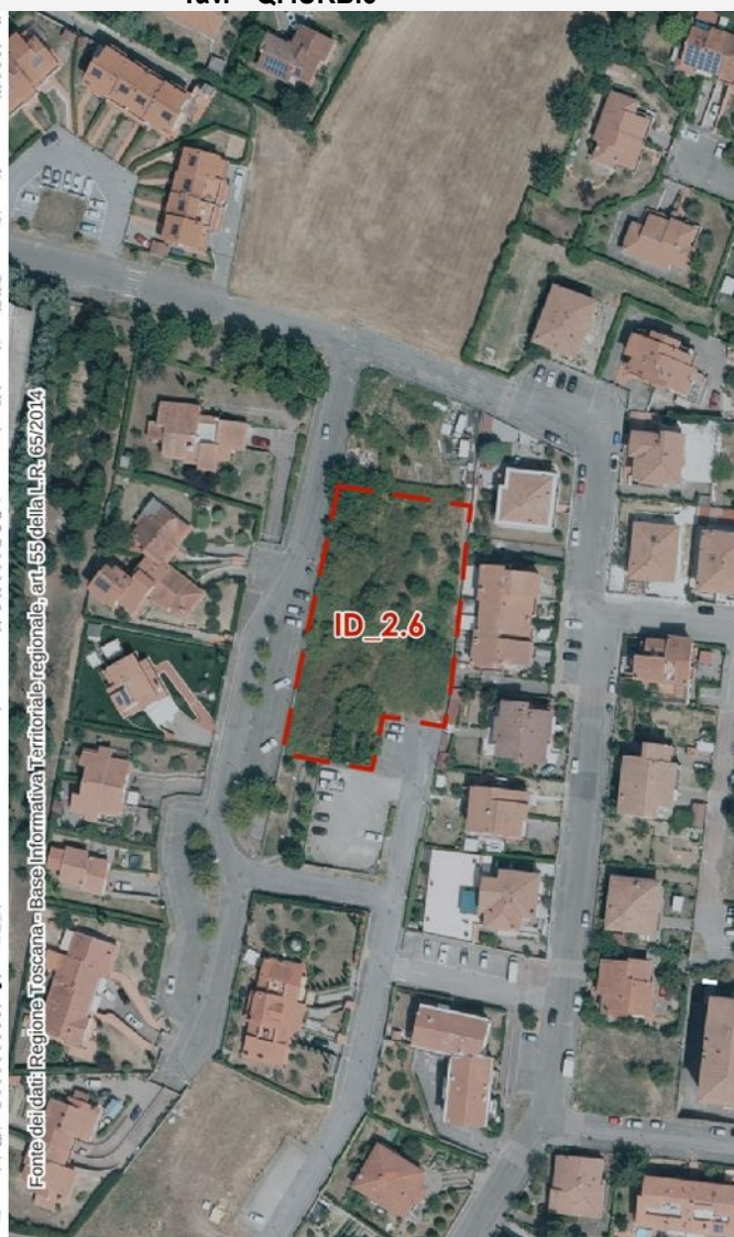
Ortofoto 2021 – scala 1:2.000