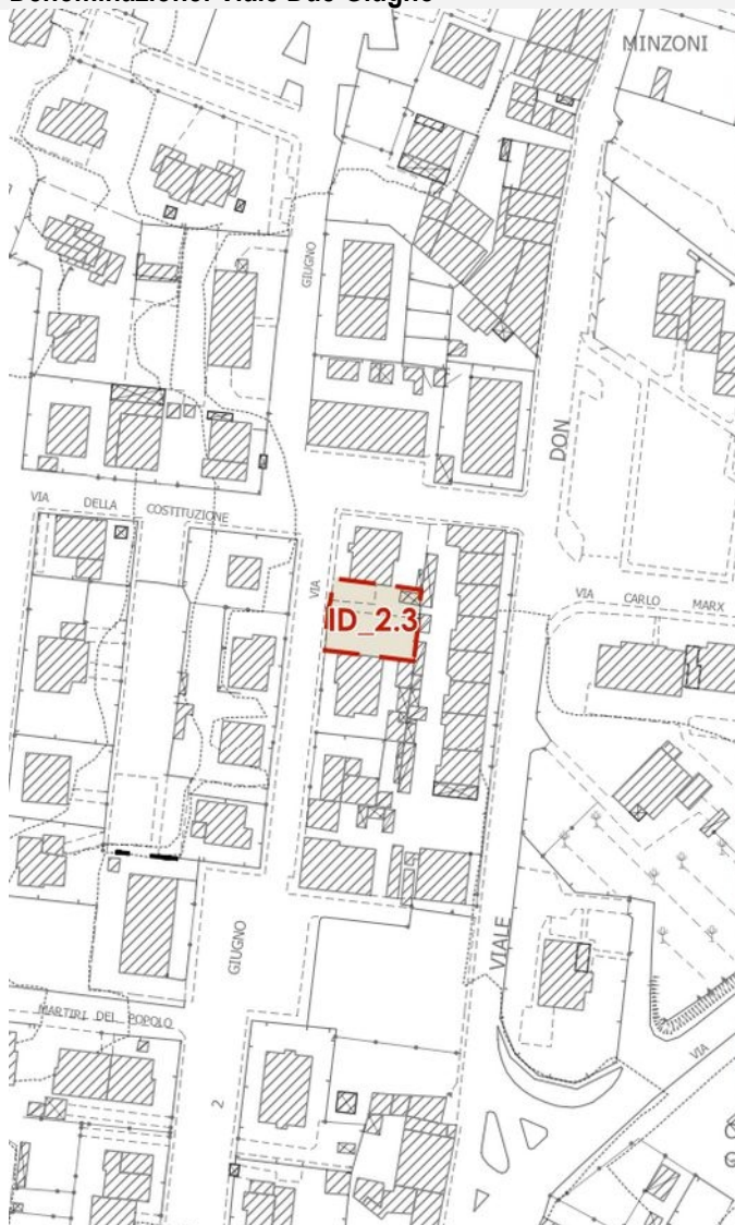
CTR – scala 1:2.000